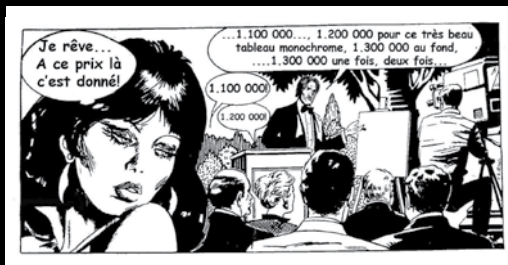
Pierre Cornette de Saint-Cyr revu par ©Michel Battle

22 h 00 : Jazz à Saint-Rémy et Art contemporain.