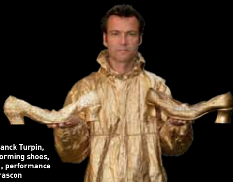
© Franck Turpin, Performing shoes, 2011, performance à Tarascon

23 h 15 : Au château royal de Provence, projection du film de la performance "Chute" et action de Julien Blaine .